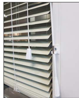
Vrvica + pregibna palica

Žaluzijo zasenčimo tako, da palico obračamo LEVO oz. DESNO, tako si nastavimo želeno osvetlitev prostora.